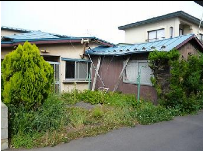
(12) 写真 (外部・内部)