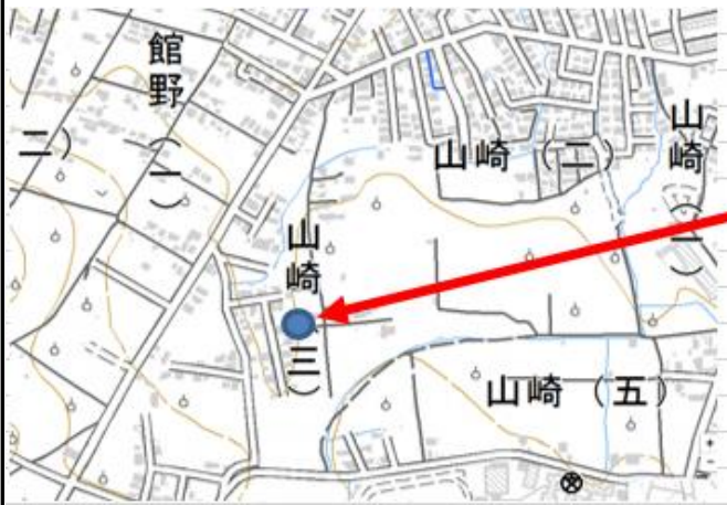
(10) 位置図・配置図 (出典: )