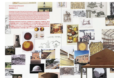
設計のためのリサーチで集められた資料も 多数掲載。