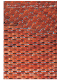
本の表紙はエントランスの 「弘前積みレンガ工法」。

「記憶を継承する建築」はどのように行われたのか、本書では、その全貌を明らかにします。弘前の歴史、煉瓦倉庫の変遷、考古学的なリサーチから導きだされた建築のコンセプト。既存の建物を解体・分析して修復する壮絶な現場の記録。そして完成後の美術館と弘前の風景まで紹介していきます。