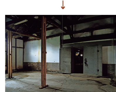
写真家の畠山直哉さんが撮影した 改修前の煉瓦倉庫の姿も。