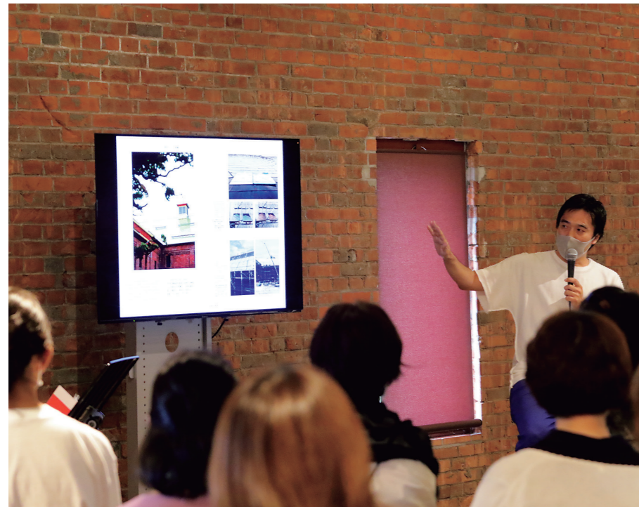
トークイベントの様子