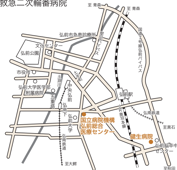
○小兒救急二次輪番病院