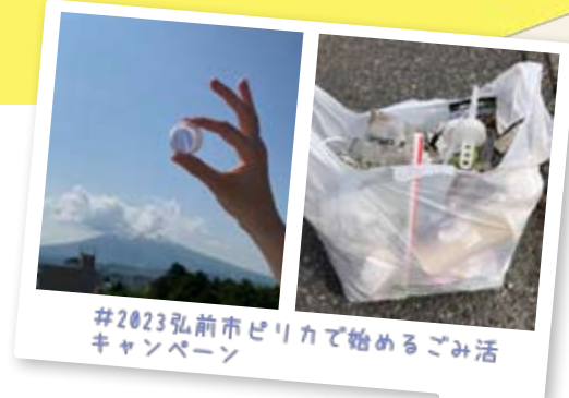
#2023弘前市ピリカで始めるごみ活 キャンペーン