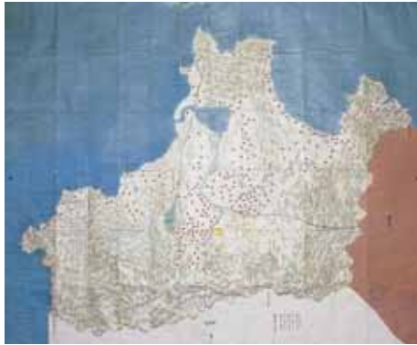
「御郡中絵図」弘前図書館所蔵

▽開催期間 10月31日〜12月20日、午前9時半〜午後4時半 ▽観覧料 一般 280円 (210円) / 高校・大学生 140円 (100円) / 小・中学生 80円 (40円)