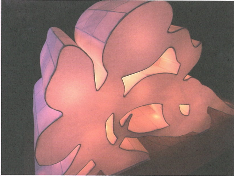
[写真/展示オブジェ制作過程] 文字デザイン/菊池錦子 制作/必殺ねぶた人

弘前城築城400年祭やNHK・大河ドラマ「江～姫たちの戦国～」(2011年)、大河ドラマ「篤姫」(2008年)の題字を揮毫した書家・菊池錦子による弘前城と桜に関連した書の展示や、立体作品をはじめ、来場者に400年への想いを書にしたためていただき完成させる市民参加型のオブジェ制作を行います。弘前の歴史と共に歩んできた「書」の現在を具現化します。同館にて菊池錦子書展(「江」作品を含む)も同時開催します。