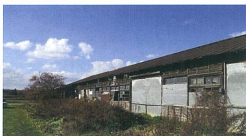
宮沢賢治が訪れた山田野の旧兵舎