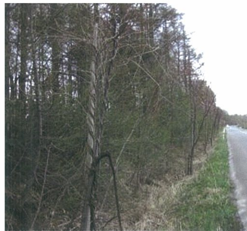
ネックレスロードの桜並木