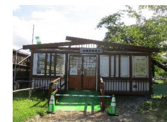
石垣普請番屋（閉鎖中）