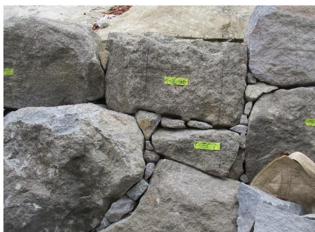
積直した石垣（令和3年9月15日撮影）