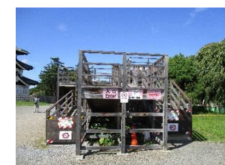
本丸展望デッキ（閉鎖中）