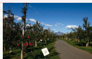
⑧りんご公園 すり鉢山展望台からは岩木山とりんご園を一望できます。時期によってりんごの成長過程も楽しめます。