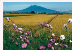
④アップルロード石川入り口付近 春と秋には一面に広がる野花と岩木山という季節限定の絶景を楽しむことができます。