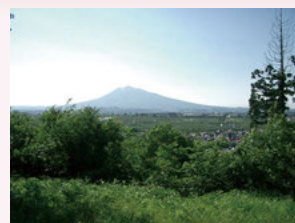
⑤狼森陸羯南詩碑(鶯の巣山) 鶯の巣山の山道を登ると、岩木山と市街地を一望することができます。

大 鰐弘前IC周辺とアップルロード周辺のエリアです。岩木山やりんご園、田園風景など弘前ならではの風景がたくさんあります。何度も来たいと思える風景ばかりです。