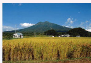
⑨三本柳温泉周辺 アップルロードを越えると、温泉の周辺はのどかな田園風景と岩木山が望め、心も体もリフレッシュできます。