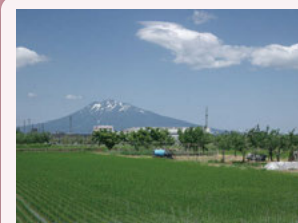
①国道7号大鰐弘前IC付近 大鰐方面から弘前に入ると、広大な岩木山と故郷を感じさせる田園風景が迎え入れてくれます。