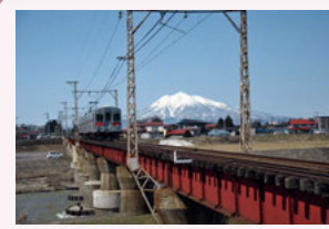
③大鰐線平川鉄橋 岩木山と鉄橋を渡る電車のコラボレーションは、弘前鉄道ならではの風景です。