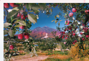
⑩三本柳 岩木山の手前にりんご畑が広がる弘前ならではの風景です。春にはりんごの花、秋には果実が楽しめます。