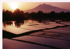
⑥墓地公園 アップルロード沿いの岩木山と田園風景を望む絶景ポイントの代表格です。