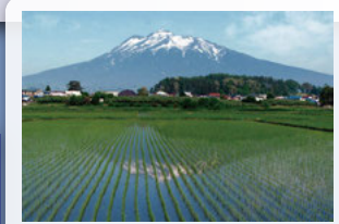
④ 独狐地区の水田 田植えの時期には、水田には美しい岩木山の姿が映ります。早朝に正面から陽が当たる風景がおすすめです。