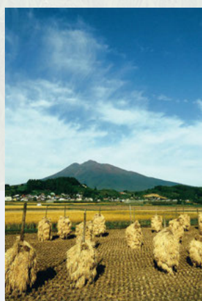
⑩ 横町野崎橋付近 岩木地区の集落を散策するとおり岩木山と田園風景が現れ、「岩木山のあるまち」を実感できます。