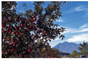
⑦ 富栄のりんご園 【やまなみロード沿い】 鯉ヶ沢方面に向かう広域農道。起伏があり岩木山とりんご園が共演する弘前らしい風景が楽しめます。

弘 前市の郊外北側から岩木地区東側のエリアです。 季節によって異なる表情をみせてくれる岩木山の眺めを中心に、桜並木やりんご園の風景も楽しめます。