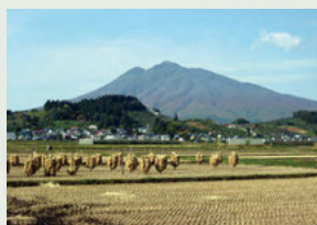
⑤ 石渡の水田 岩木川の西岸には田園地帯が広がり、岩木山の眺めと調和し、なんだか懐かしい気持ちになります。