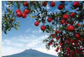
⑧ 富栄のりんご園 【独狐蒔苗線沿い】 岩木方面へ向かう道路沿いもりんご園が広がります。りんごの隙間から岩木山も顔をひょっこり。