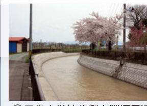
③ 三省小学校北側土淵堰周辺 春は桜並木、秋はりんごの実が生り、堰の疏水と共に潤いのある風景が楽しめます。