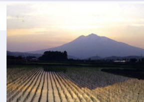
⑪ 真土保育園前 四季折々の岩木山と田園風景。美しい風景と共に外で遊ぶ園児たちは、何を感じているのでしょうか…