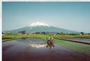
⑨ 横町の田園 【元薬師堂一町田線沿い】 田園に囲まれたまっすぐな道。岩木山、田園そして農村風景が続く岩木地区ならではの風景です。