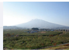
⑥ 独狐の森公園 小高い丘の上の公園からりんご園と岩木山が一望できます。映画「奇跡のリンゴ」のロケ地にもなりました。