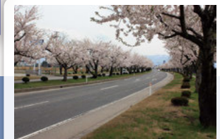
① 国道7号線桜並木 弘前市民は、ここに咲き誇る約370本の桜を見て、春の訪れを実感するのだとか…