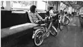
鰐子の「おさんぽ日和」で紹介