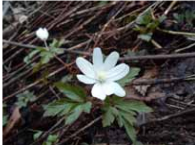
キクザキイチリンソウ

だんぶり池は、人里から一番離れた最後の田んぼということもあり、里山や水辺に自生する様々な植物も観察できます。以下はその一部ですが、だんぶり池での実際の写真です。