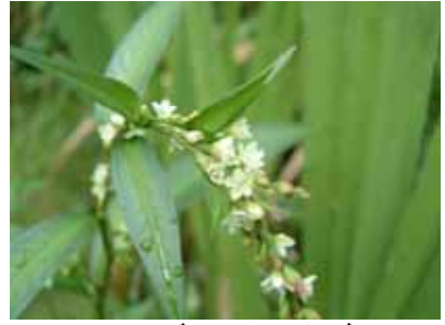
シロバナサクラタデ