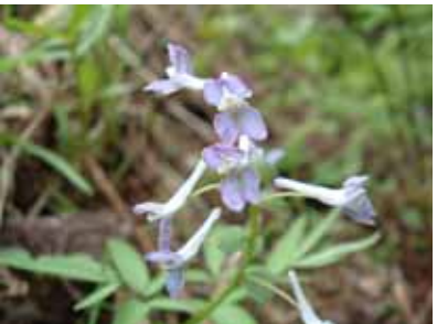
ミチノクエンゴサク