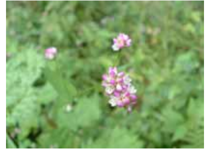
ナガハノウナギツカミ