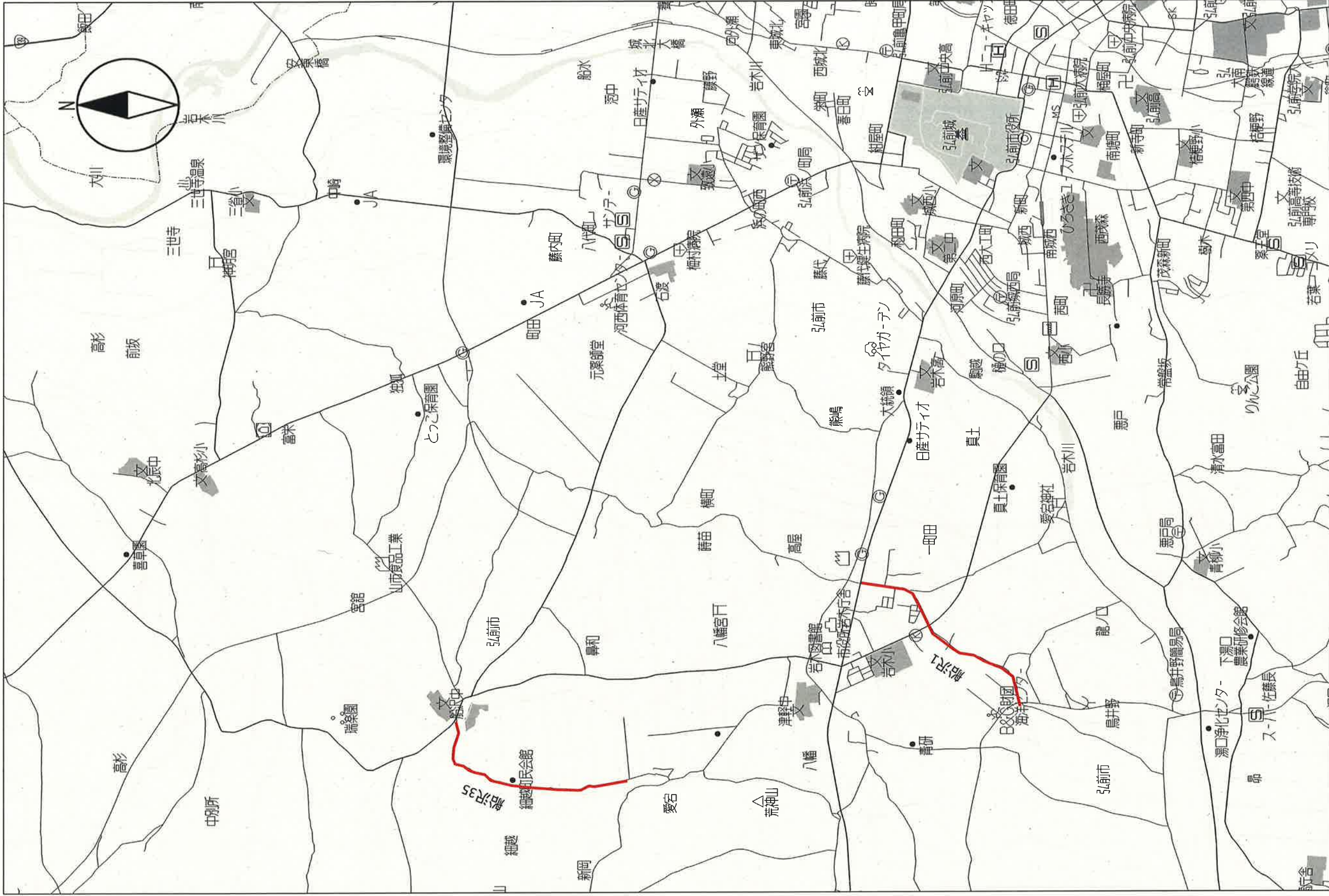
区画線改修工事(2工区)(ゼロ市債)