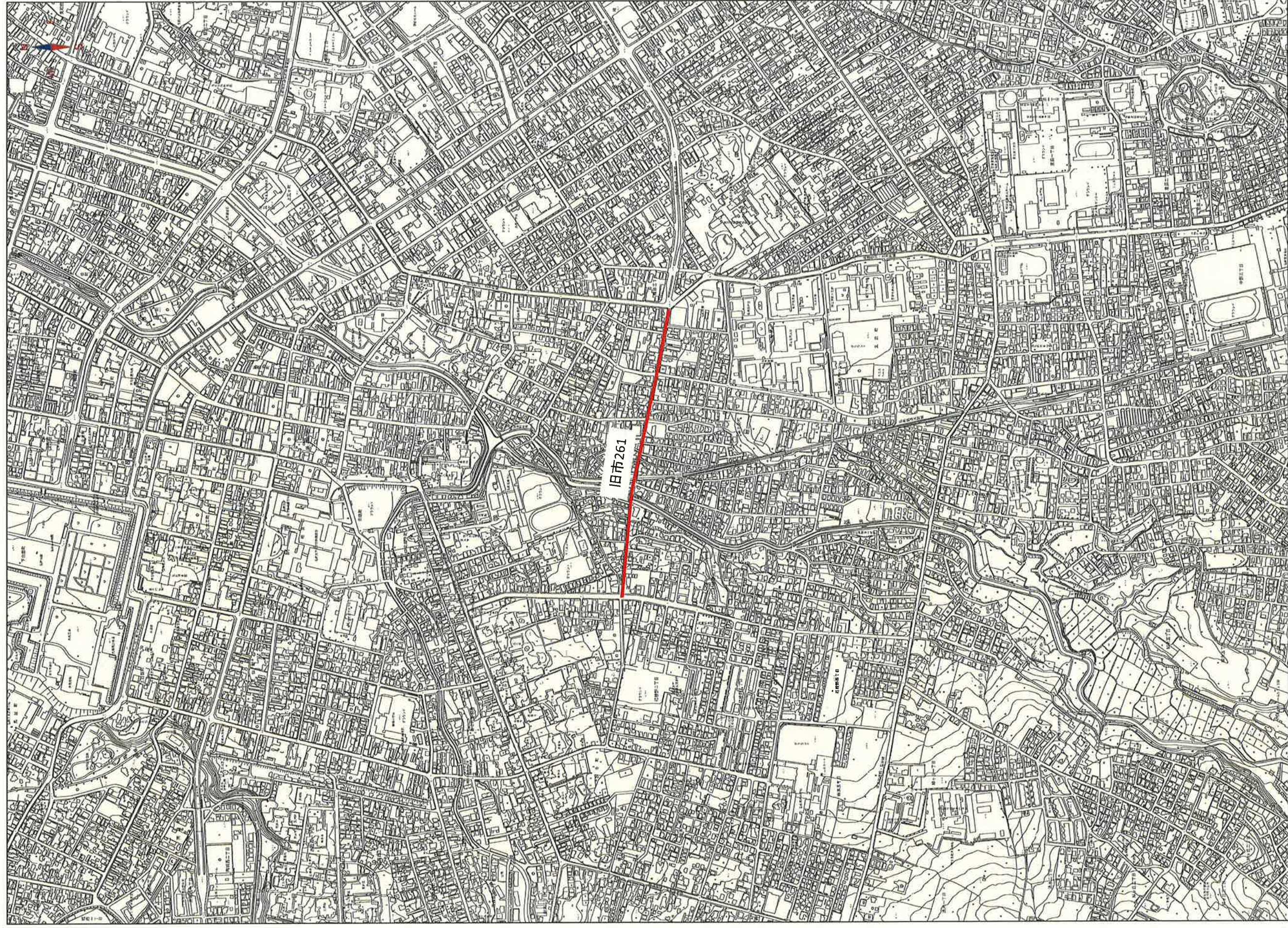
位置図① S=1:10,000 平成29年度 区画線改修工事(5工区)(ゼロ市債)