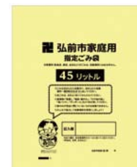
平袋 （サイズは 30、45 リットル）