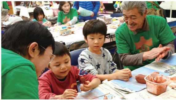
11月24日・25日 岩木文化センター（賀田1丁目）ほか

文 化体験コーナーや作品展示、芸能発表などが行われ、子どもから大人まで幅広く参加しました。参加者は土器作りを体験するなど、歴史や文化とふれあいながら交流を楽しんでいました。