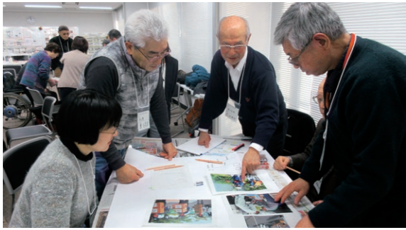
12月1日 弘前市役所（上白銀町）

町 会活動を町会の皆さんに伝えるのに役立つ「町会便り」の作り方を学ぶ講座を開催。参加者は班に分かれ、アイデアや工夫を凝らした町会便りを見事なチームワークで完成させていました。