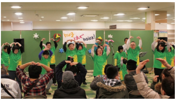
12月8日・9日 ヒロコ（駅前町）

障 害者週間記念イベントとして、キッズアートの展示や障がい者スポーツ体験、ダンスの披露などが行われました。参加者は生き生きと出し物に取り組んでいました。