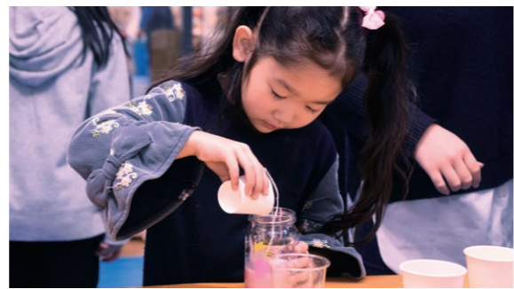
12月8日 弘前地区環境整備センタープラザ棟（町田字筒井）

使 い残しのろうそくや空きびんを使ってオリジナルキャンドルやミニツリーを作るエコ体験教室を開催。子どもたちはわくわくした表情で可愛いクリスマス飾りを作っていました。