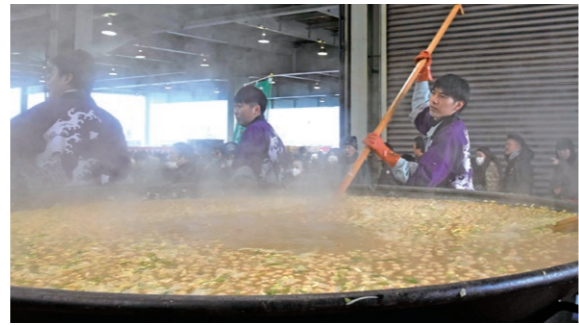
11月25日 弘前水産地方卸売市場（末広1丁目）

新 鮮な地場産品などの消費拡大を目的に、模擬競り大会やカニ鍋のふるまい、マグロの解体販売などが催され、食事を楽しむ人や食材を買い求める人たちが、市場中が活気に満ちていました。