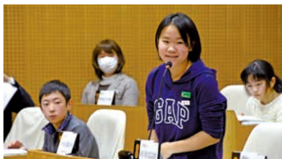
12月26日 弘前市役所（上白銀町）市議会議場

市 内40校から小学生46人、中学生50人が参加し、「弘前の魅力である『伝統・文化』」をテーマに議論しました。子どもたちは活発に意見を交換し合ったり、質疑応答したりしていました。