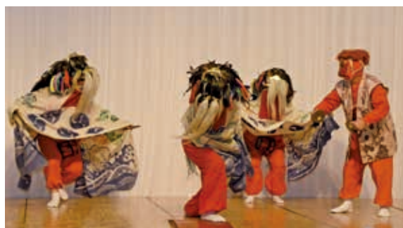
1月4日 ホテルニューキャッスル（上鞆師町）

約 220人の参加者が集まり、新春を祝うとともに、市民の皆さんの活躍と市の発展を祈願しました。余興では市指定無形民俗文化財である「鳥井野獅子踊」が披露されました。