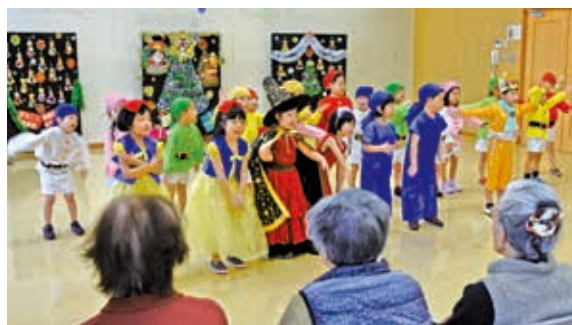
12月20日 中央公民館相馬館（五所字野沢）

手 作りのクリスマス会が開かれ、子どもたちがお年寄りに歌やダンスを披露しました。元気いっぱいの子もたちに、お年寄りにはこっくりと笑顔を浮かべ、温かい拍手を送っていました。