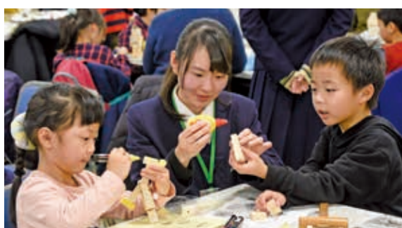
1月6日 ヒロコ（駅前町）イベントスペース

木 を使ったエコ・ロボット「ロボ木ー」を作る親子ワークショップが開催されました。子どもたちは夢中になってロボ木ーを組み立て、色々な素材を使って飾り付けをしていました。