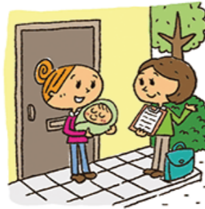
「民生委員協力員証」を携帯し、見守り活動や地域福祉活動を行います。

民生委員・児童委員は、高齢者、障がい者、生活困窮者、子育て家庭などの見守り活動を行っています。対象者の自宅を訪問して相談に応じ、支援が必要なときには、市役所、社会福祉協議会、地域包括支援センターなどの関係機関につなぐ「橋渡し役」となります。主任児童委員は、子どもや子育て家庭への支援を専門に担当する民生委員・児童委員です。学校、児童相談所などの関係機関と連携し、子育ての支援や児童健全育成活動を行います。市では、398人（定数）の民生委員・児童委員（主任児童委員）が活動しています。また、平成30年10月からは、地域福祉活動の充実のために民生委員の活動をサポートする「民生委員協力員制度」を導入しました。協力員は「民生委員協力員証」を携帯し、見守り活動や地域福祉活動を行います。