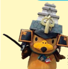
津軽まちあるきホームページ