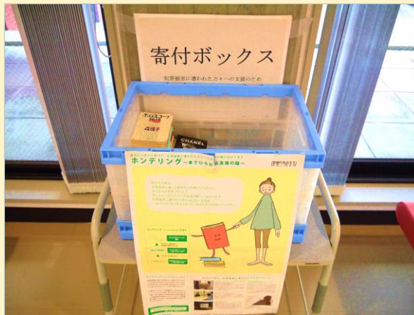
寄付ボックス設置場所

弘前市は、全国被害者支援ネットワークが実施する「ホンデリング・プロジェクト」に協力しています。 不要となり寄付いただいた本（※）の売却代金が、 犯罪被害にあわれた方々への支援活動に役立てられます。