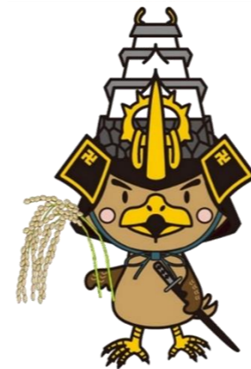
弘前市 マスコットキャラクター たか丸くん