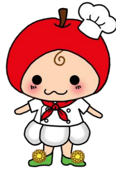
青森県学校栄養士協議会 食育推進キャラクター あぷにん