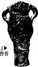
「オニ」▶ 三井 啓吾