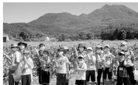
岩木山を背に嶽きみ農園にて

会場を移動しての加工体験では、ドレッシング作りに挑戦しました。茹でたての嶽きみを、包丁で芯から切り離し、ペースト状にした後、調味料を加えてドレッシングが完成すると、参加者はその場で出来栄を味わっていました。