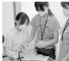
調理体験（左）と加工体験（中央・右）のーコマ