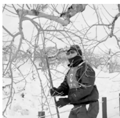
昨年の実技の様子