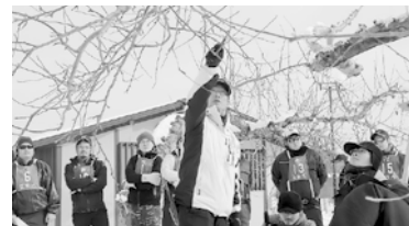
昨年の模範樹せん定の様子

農業委員会では、せん定技術の向上を目指し、地域後継者間の連携を図るため、農業後継者りんご整枝せん定講習会兼競技会を開催します。意欲ある皆さんの参加をお待ちしています。