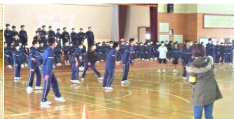
3年生のドッチボール