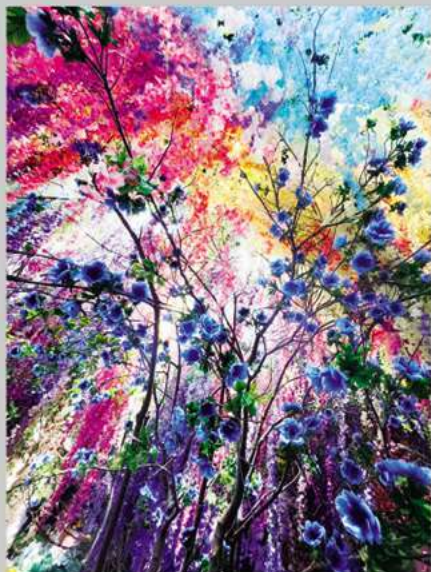
参考図版 蜷川実花《Intersecting future 蝶の舞う景色》2023年 ©mika ninagawa, Courtesy of Tomio Koyama Gallery