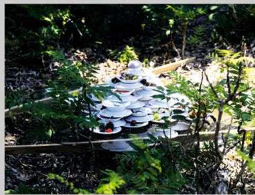
参考図版 狩野哲郎《21の特別な要求》2021年 Courtesy of the artist