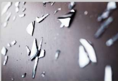
写真上・下 蜷川実花《うつくしい日々》2017年 ©mika ninagawa, Courtesy of Tomio Koyama Gallery