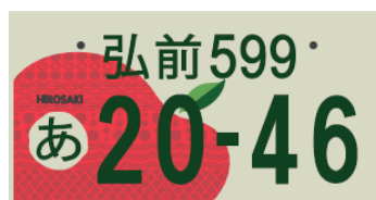
⑤ 弘前になるりんご