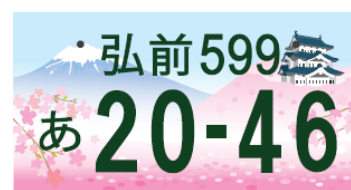
③ 弘前城・桜色のお堀と岩木山