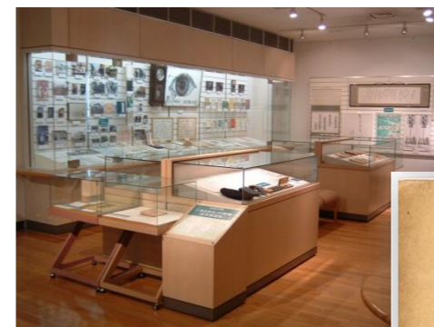
▲『『まるめろ』の飛翔 高木恭造展』