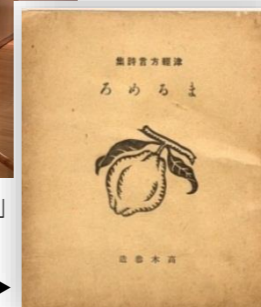
『津軽方言詩集 まるめろ』▶ 『北』編集所 昭和6年10月5日