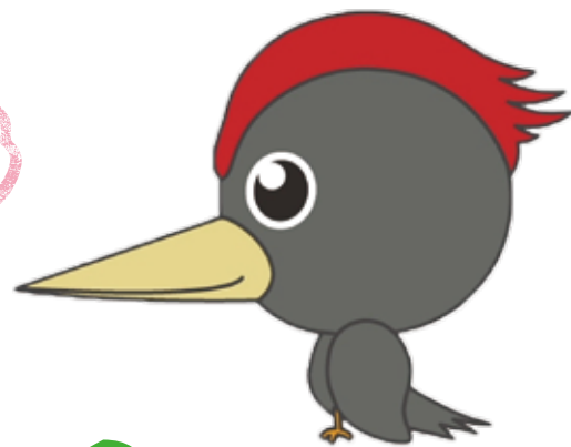
白神山地に棲む天然記念物 くまげら