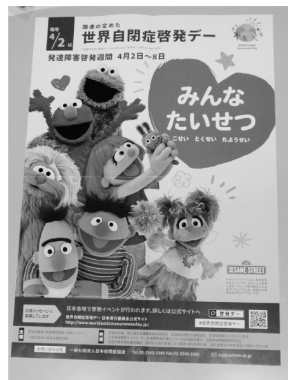
※国連が定める啓発デーには3月21日の「世界ダウン症の日」もあります。