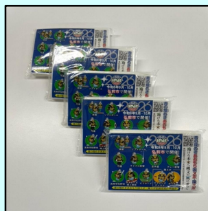
ポケットティッシュ