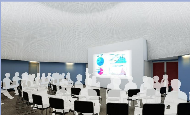
多目的活動室(旧プラネタリウム)の活用イメージ