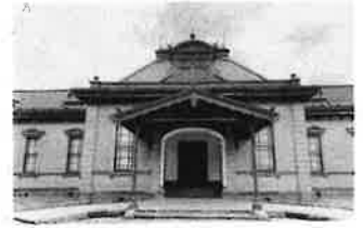
弘前は歴史、文化、観光など体験学習素材の宝庫