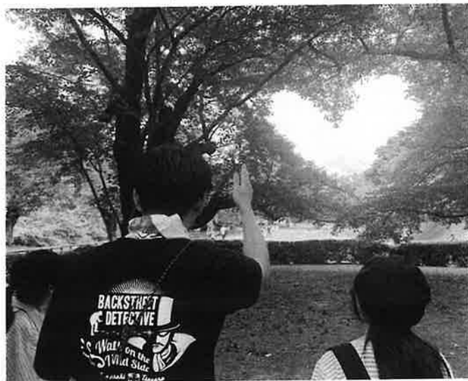
多様な学びの中で、地域の魅力再発見と家族の絆を深める (写真はイメージです)

もう一つには、子どもと保護者の交流を増やすことが挙げられております。保護者が土日に働いている家庭では、家族と一緒に過ごす時間が少ない現実があります。平日の休みが欠席扱いにならないラーケーションを導入すれば、 子どもが保護者の休みに合わせて学校を休めるため、家族一緒にさまざまな活動ができます 。