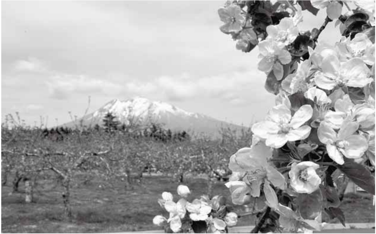
(岩木山とりんごの花 平成22年5月16日りんご公園にて)