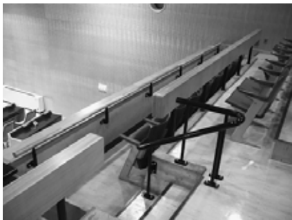
(傍聴席に手すりが付きました)

議会の本会議(開会日、一般質問、閉会日)はどなたでも傍聴することができます(午前10時開会)。