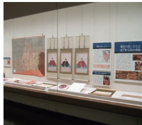
歴史展示室 近世コーナー