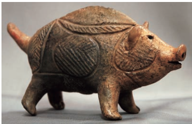
国指定重要文化財「猪形土製品」