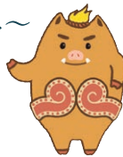
マスコットキャラクター「いのっち」

縄文から近現代までの弘前の歴史を、各時代を特徴づけるテーマを設けて紹介しています。お山参詣やねぶたなどの民俗分野の資料も併せて展示しています。 ※特別企画展開催中は一部縮小することがあります。