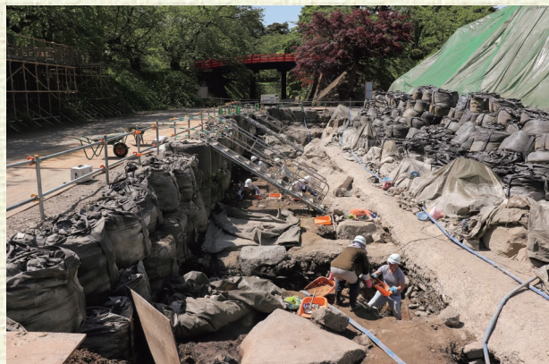
▲天守台根石付近の発掘調査風景（北から）