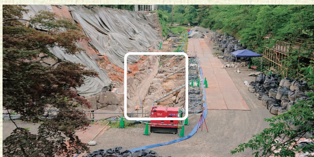
▲令和元年度の発掘調査地点（下乗橋から北を望む）

弘前図書館所蔵の「明治29年4月8日本丸天守閣石垣崩壊の図」（※2）は、当時天守台とその北側の石垣が大きく崩落・変形したことを現在に伝える資料です。帯コンクリートと石列は、図に描かれる石垣の崩壊・変形範囲内に収まるような位置に施工されています。明治29年以降、崩れた状態で長期間放置されてきた石垣を、再度強固に積み直そうとした大正時代の職人たちの工夫が感じられる遺構です。