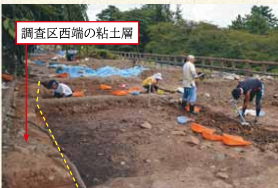
△築城時のものと推定される橙色粘土の盛土層

平成27年度のさくらまつり後には、現在の発掘調査範囲の北側部分の精査を進めます。また、曳屋（ひきや）工事により天守が移動している9月中ごろには、天守台の発掘調査に着手する予定です。弘前城に残る江戸時代の痕跡を確認できるか、興味深いところです。※次回連載は、平成27年度に掲載を予定しています。