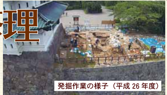
発掘作業の様子（平成26年度）

発掘調査は、石垣を解体前と同じ構造に積み直していく前段階として、石垣の構造や本丸平場に残る遺構の状況を記録に残すため実施しているものです。平成25年度より、本丸東側石垣修理工事対象範囲700㎡において、本丸平場の面的な発掘調査を行っています。