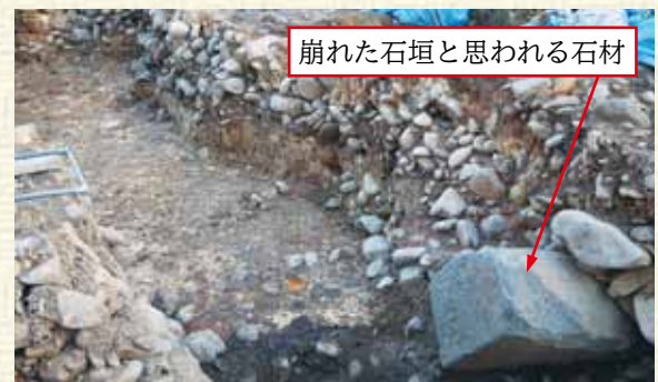
△明治～大正時代に石垣崩落部分を修復した盛土

また、明治～大正時代の石垣崩壊・修理に関わる成果についてですが、明治時代に描かれた「本丸天守閣石垣崩壊の図」には、天守台から北に十間半（約19m）の範囲で石垣が崩壊したと記録されています。発掘調査では、この記録とほぼ同じ範囲において、径20cmほどの玉石を多く含む白色粘土の広がり確認されました。この粘土層には、当時崩れた石垣石材が混入しています。更に、当時は石垣崩壊範囲よりも広く、天守台から北に40m付近まで石垣を積み直していることも判明しました。