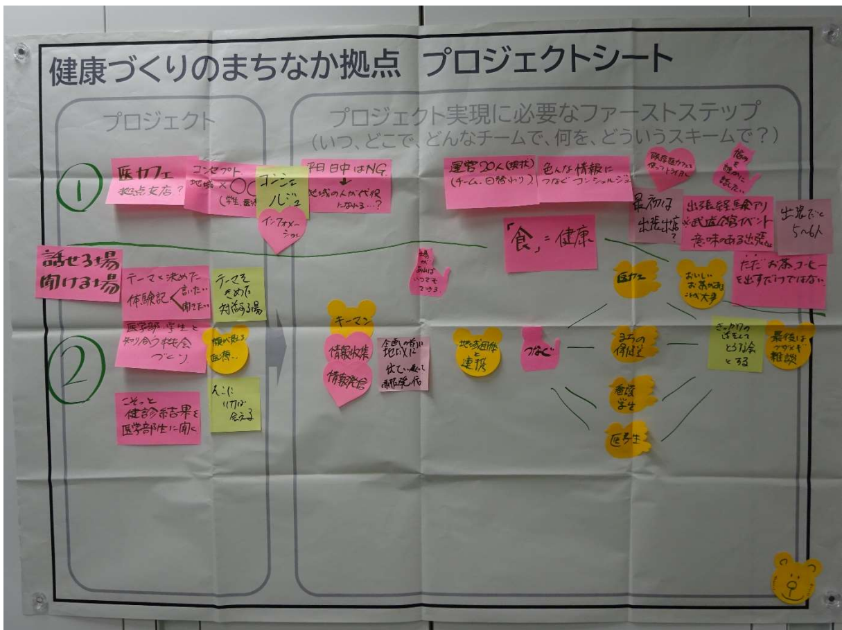
(グループ発表資料 ~テーマ「サービス・情報提供」~)