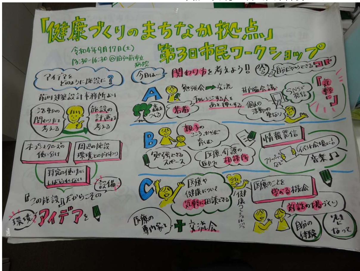
(グラフィックレコード1)