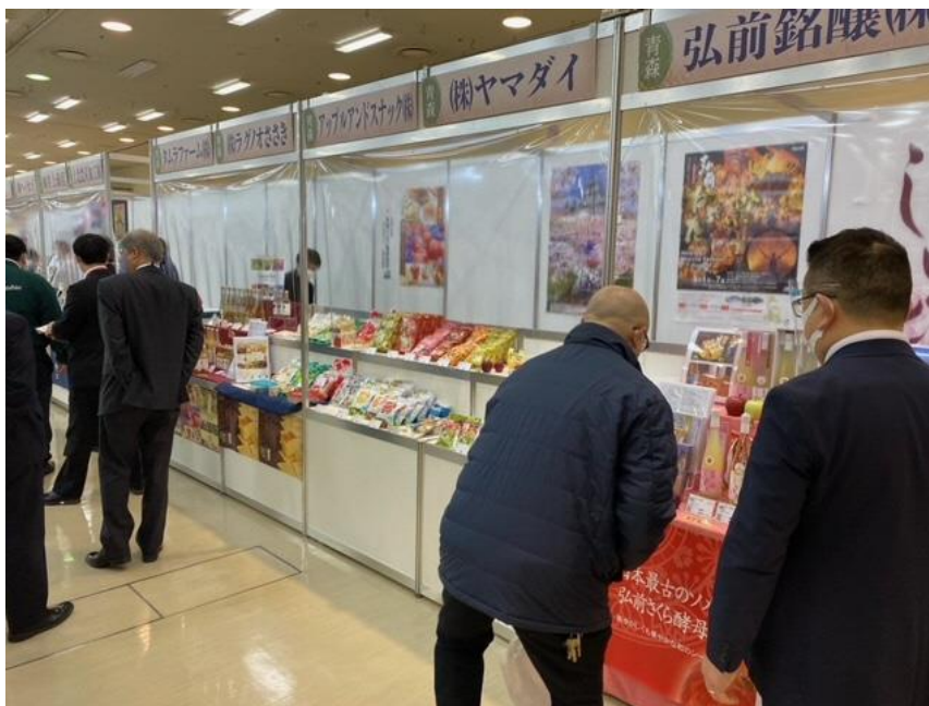
「旭食品フーズム 2022（開催場所：神戸）」への出展