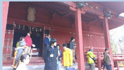
高照神社を見学する様子

その後意見交換会を行い、「百沢地区を今後どうしていきたいか？」について議論を交わしました。今後も百沢小学校の校舎の利活用方策などについて検討していく予定です。