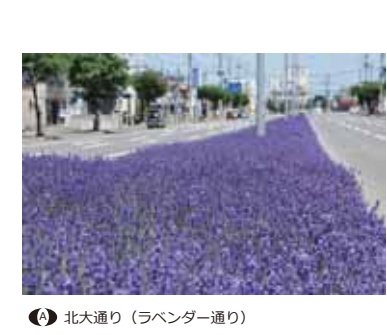
● 北大通り (ランドナー通り)