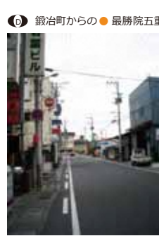
● 鍛冶町からの ● 最勝院五重塔