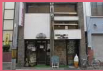
05 名曲&珈琲ひまわり [坂本町 2 昭和 34 年建築] 昭和 34 年の建築以来、外観や内装などがほぼ当時のまま。絵画展やコンサートが開かれるなど、弘前の文化の発信地にもなっている喫茶店です。