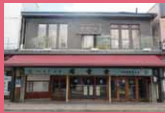
04 開雲堂 [土手町 83 昭和 4 年建築] 銅板の外壁が看板建築の特徴を残す老舗和菓子店。津軽藩の旗印で市章にもなっている卍をかたどった最中が名物です。