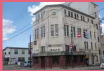
06 三上ビル（旧弘前無尽社屋） [元寺町 9 昭和 2 年建築] 登録有形文化財。東北でも初期の鉄筋コンクリート造の建物。アールデコ調のデザインが洒落た社屋ビルです。

市 の玄関口である JR 弘前駅中央口を出発します。 大正十二年、東北初となる百貨店もあった土手町を通り、旧第五十九銀行本店本館に向かいます。そのあと最勝院五重塔、弘前れんが倉庫美術館など様々な年代の建物を見ながら土手町の 100 円バスルートにもどるコースです。