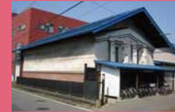
10 鎌田屋商店 (蔵) [和徳町 3-1 昭和 10 年建築] 大正 8 年創業の海鮮物問屋の老舗。土淵川沿いに建つ蔵は、現在では事務所兼倉庫として活用されています。