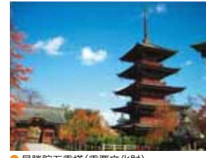
● 最勝院五重塔 (重要文化財)