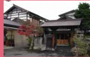
09 平野 [徒町川端町 7 大正 3 年建築] 土淵川沿いにたたずむ門構えが目を引く建物。大正時代に民家として建てられた建物ですが、昭和 30 年から割烹として営業されています。