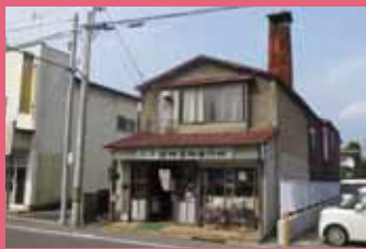
01 保村打刃物製作所 [代官町 68-2 昭和 38 年建築] 旧羽州街道沿いにある煙突が特徴的な建物。さびない牛刀包丁などを製作する津軽打刃物職人の店です。