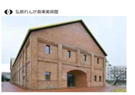
● 弘前れんが倉庫美術館