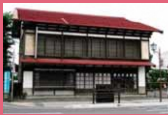
02 小野金商店 [北瓦ヶ町 6 昭和 3 年建築] 窓の縦格子が特徴的な、昭和初期のたたずまいを残しているわら工芸品店だった建物です。現在は猫をモチーフにしたハンドメイド雑貨を販売しています。