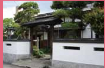
07 高砂そば [親方町 1-2 昭和 48 年建築] 歴史を感じさせる門構えの老舗蕎麦屋。棟方志功も帰郷の際にはよく訪れました。