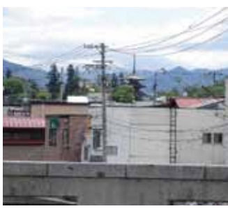
● 蓬萊橋からの ● 最勝院五重塔