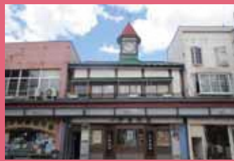
03 一戸時計店 [土手町 87 明治 32 年建築] 開業当時の円錐屋根の時計台は、現在でも土手町のシンボルとして親しまれ、中土手町商店街振興組合の事務所として活用されています。