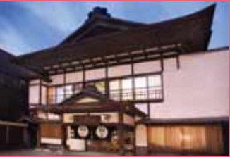
08 小堀旅館 [本町 89 昭和 3 年建築] 入母屋の大屋根と高い軒高が特徴的な建物。建物内の土蔵や暖簾など、歴史を感じさせてくれる老舗旅館です。