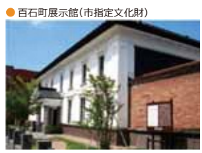
● 百石町展示館 (市指定文化財)