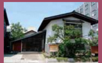
32 御料理 なる海 [本町34 天保4年(1833年)建築] 質屋として建築された蔵は、明治時代には銀行の金庫蔵として活用され、現在では、人気の懐石料理店となっています。