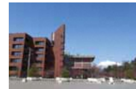
●追手門広場からの ●弘前市庁舎