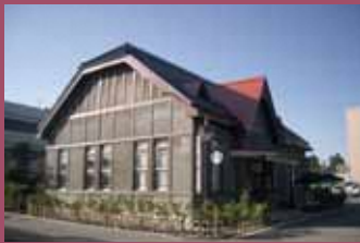
22 旧第八師団長官舎 (弘前市長公舎) [上白銀町1-1 大正6年建築] 登録有形文化財。堀江佐吉の長男、堀江彦三郎の設計。大正時代の洋風高級住宅を彷彿させる建物です。現在はコーヒーストアとして活用され新たな観光スポットになっています。