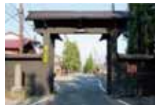
●黒門(市指定文化財)