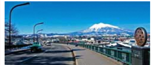
城西大橋からの岩木山