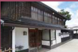
29 旧町田家住宅 [新寺町129 明治末期建築] 明治時代の旧商家。寺院街の町並みに溶け込んで落ち着いた雰囲気を感じさせています。