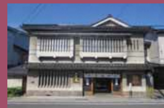
31 大阪屋 [本町20 昭和28年頃建築] 寛永7年(1630年)創業の老舗の和菓子店。津軽藩の御用菓子司として代々受け継ぎ、現在は13代目です。