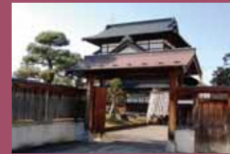
26 下山家住宅 [茂森新町3丁目1-3 昭和20年建築] 正面玄関側に切妻型の大きな屋根、白漆喰の妻壁に格子状の梁や束が美しい「吾妻建ち」の特徴を残した建物です。