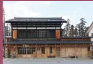
24 酒舗 成豊 [茂森町83 昭和7年建築] 禅林街の門前町、また相馬・目屋地区の街道沿いの町家。当時を感じさせる建物で、地酒も多く取り扱う老舗の酒店です。