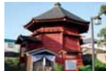
●栄螺堂(市指定文化財)