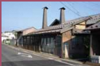
27 田澤刃物製作所 (清水一國) [茂森新町2丁目3-11 昭和5年建築] レトロな親子煙突が特徴的な建物。「清水一國」印のりんご剪定鋏は、全国の果樹生産者に愛用されている津軽打刃物店です。