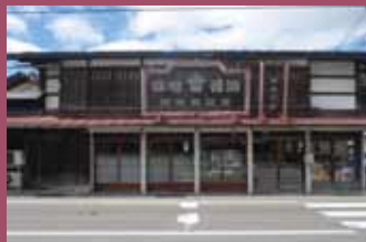
28 加藤味噌醤油醸造元 [新寺町153 明治4年建築] 創業当時のたたずまいを残した建物。ここでは昔ながらの製法で津軽の味噌と醤油の味が守り続けられています。加藤坂(通称)からの風景は、どこか懐かしささえ感じられます。