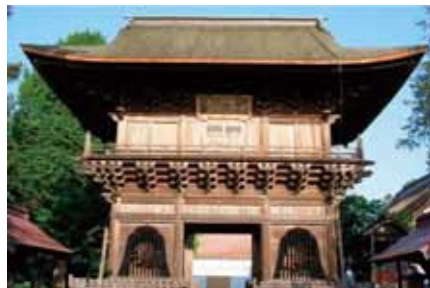
●長勝寺三門(重要文化財)