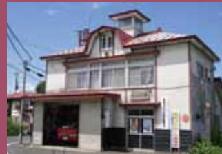
25 茂森会館消防西第一分団 [西茂森1丁目1 昭和11年建築] 禅林街入口の枳形に位置し、望楼付きの洋風デザインが目目を惹く建物です。