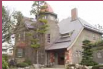
23 旧藤田家別邸 [上白銀町8-1 大正10年建築] 登録有形文化財。洋館は、日本商工会議所会館をつとめた弘前市出身の藤田謙一の別邸。大正ロマン溢れる建物です。