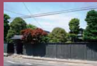
30 木村家住宅 [在府町1-1 江戸期建築] 藩政時代に上級武士が多く住んでいた在府町にある建物。薬医門、黒板塀、坪庭などの屋敷構えから家格の高い屋敷であったことがうかがえます。