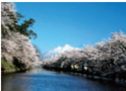
g 外濠と岩木山 (津軽藩ねぶた村前)