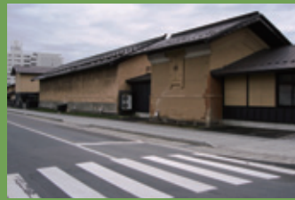
16 津軽藩ねぶた村 (蔵) [亀甲町 61 慶応元年 (1865 年) 建築] 藩の米蔵として建てられ、後に小学校の校舎や味噌蔵としても活用された土蔵は、現在では津軽塗やごぎん刺し、弘前こけし、津軽焼、津軽凧など弘前の民芸品の工房として活用されています。

弘 前公園にほど近い文化センター前バス停から出発します。弘前公園周辺の洋風建築と和風建築を見ながら伝建地区を目指し弘前公園の外堀を歩きます。武家屋敷の町割りを通り弘前公園に入り、本丸から岩木山を堪能したあと前川建築を見て 100 円バスのルートにもどるコースです。