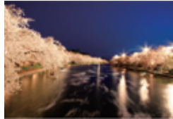
i 春陽橋からの西濠