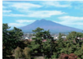
k 弘前城本丸からの岩木山