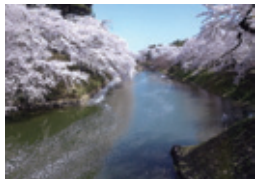
l 杉の大橋からの中濠