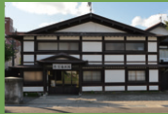
13 石場旅館 [元寺町 55 明治 12 年建築] 登録有形文化財。黒塗りの付け梁と白い漆喰壁が、城下町弘前の風情を醸し出している老舗の旅館です。