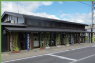
17 川崎染工場 [亀甲町 63 1800 年頃建築] 寛政時代に創業した天然藍染めの染物屋。藩政時代の風情を醸し出しています。