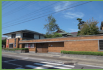
12 翠明荘 (旧高谷家別邸) [元寺町 69 昭和 8 年建築] 登録有形文化財。青森銀行頭取を務めた高谷英城の別邸。総繪・入り母屋造りの建物のほか、洋館は旧帝国ホテル「ライト館」風の建物となっています。