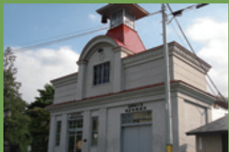
19 旧弘前市消防団西地区団第四分団消防屯所 [紺屋町 2-2 昭和 8 年頃建築] 高さ 14.3 m の火の見櫓がある洋風の外観が洒落た建物。当時の名士の寄付により建築されました。