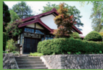
15 竹田家住宅 [下白銀町 15 明治中頃建築] 江戸時代に同地にあったとされる武家住宅の形式を受け継いでいる古色を残した建物です。