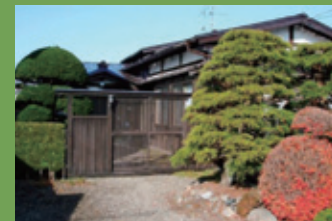
20 工藤家住宅 [五十石町 30 江戸期建築] 枯山水の形式を取り入れた前庭や門構えなどから藩政時代の雰囲気醸し出されています。