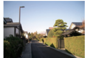
f 仲町伝統的建造物群保存地区