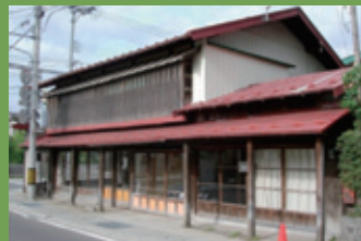
18 山口製畳所 [紺屋町 77 明治期建築] 正面のこみせや、店の奥にある蔵をつなぐ通り土間など、今では少なくなった町屋の形式が残っています。