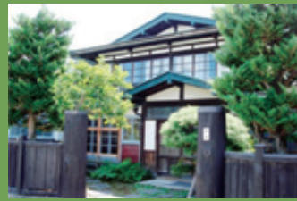
14 旧杉山醫院 [百石町小路 3 明治期建築] 明治期に建てられた母屋に、昭和 20 年代に増築された医院部分とともに創業当時の姿がよく残されている建物です。