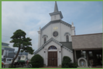
11 カトリック弘前教会 [百石町小路 20 明治 43 年建築] 堀江佐吉の弟、横山常吉が施工した尖塔をもつロマネスク様式の木造建築。神の救いの歴史を表現したステンドグラスが美しい彩を添えています。