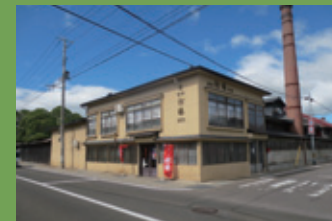
21 (株) 松緑酒造 [駒越町 58 江戸時代後期建築] 黒板塀とそこから見える松の姿や、煉瓦の煙突がシンボルとなっている造酒屋です。