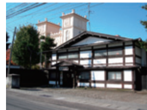
石場旅館と ● 日本基督教団弘前教会 (県重宝)