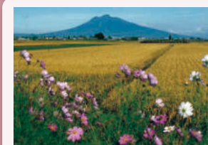
④アップルロード石川入り口付近 春と秋には一面に広がる野花と岩木山という季節限定の絶景を楽しむことができます。