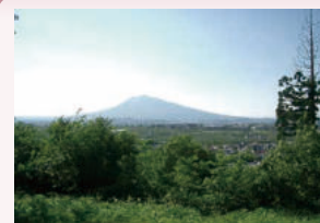
⑤狼森陸羯南詩碑(鶯の巣山) 鶯の巣山の山道を登ると、岩木山と市街地を一望することができます。

大 鰐弘前IC周辺とアップルロード周辺のエリアです。岩木山やりんご園、田園風景など弘前ならではの風景がたくさんあります。何度も来たいと思える風景ばかりです。