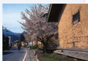
⑦小沢蔵街道 蔵が並ぶ津軽地方ならではの農村景観。背景には久渡寺山が望め、故郷を感じさせるような風景です。