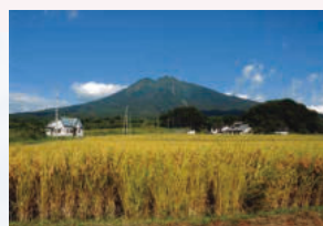
⑨三本柳温泉周辺 アップルロードを越えると、温泉の周辺はのどかな田園風景と岩木山が望め、心も体もリフレッシュできます。