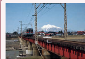
③大鰐線平川鉄橋 岩木山と鉄橋を渡る電車のコラボレーションは、弘南鉄道ならではの風景です。