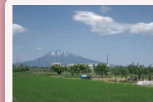
①国道7号大鰐弘前IC付近 大鰐方面から弘前に入ると、広大な岩木山と故郷を感じさせる田園風景が迎え入れてくれます。