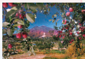
⑩三本柳 岩木山の手前にりんご畑が広がる弘前ならではの風景です。春にはりんごの花、秋には果実が楽しめます。