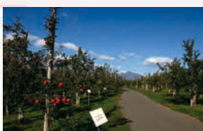
⑧りんご公園 すり鉢山展望台からは岩木山とりんご園を一望できます。時期によってりんごの成長過程も楽しめます。