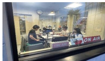
収録中のスタジオ