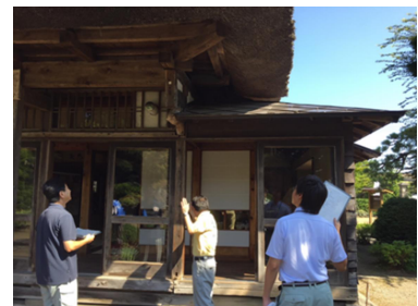
文化財パトロールの様子

国及び県が指定する文化財において修理が必要となった場合は、国の指定文化財は、文化庁と青森県教育委員会の指導の下、県の指定文化財は青森県教育委員会の指導の下、所有者と協議の上で修理計画を作成し、適正な維持のための修理を実施する。建造物については、