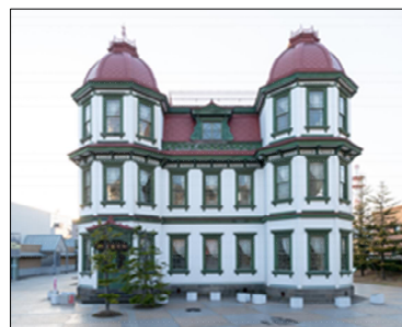
旧弘前市立図書館

旧弘前市立図書館は、弘前を代表する明治の洋風建築の一つであり、弘前城南東部の追手門広場に立地する。近年、屋根飾りが落下するなど、屋根周りを中心に老朽化が進み、雨漏れが頻繁に起きるなど、文化財建造物としての価値の喪失につながるような状況にあったことから令和2年度に屋根の葺き替え等を実施した。今後も文化財建造物の健全性を確保し、適正に管理を進めていくことを目指す。