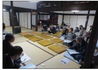
保存計画見直しに係る住民説明会