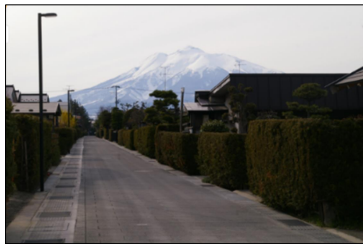
弘前市仲町伝統的建造物群保存地区

藩政時代の武家住宅としての街並み及び景観の維持保存を図る。一般の民家には、地区の景観に合わせた修景等の費用を補助するなどして保存に努めているが、今後も継続して保存整備を図る。令和3年3月に行った保存活用計画見直しにより、修理修景補助及び現状変更許可の基準が明確となり、地割の改変・大規模施設の建設等による地区の景観阻害を防ぐとともに、雪対策など、住環境の向上が見込まれる。