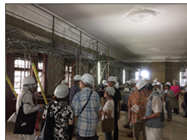
旧弘前偕行社修理現場公開