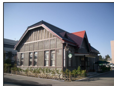
旧第八師団長官舎 (登録有形文化財)

保存修理事業を実施する建造物等は、施工中の一般公開や屋根葺き、土壁塗り、木材の削り方など職人による伝統技法の実演などの公開を推進する。