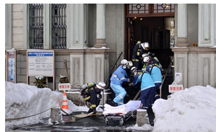
文化財防火デーの様子

文化庁・消防庁が位置付けている1月26日の文化財防火デーにあわせ、毎年市内の指定文化財建造物において防災訓練を行っており、今後も継続する。