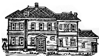
旧東奥義塾外人教師館