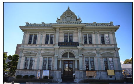
旧第五十九銀行本店本館

明治37年(1904)に旧第五十九銀行の本店として建てられ、設計・施工は堀江佐吉 ほりえ さきち によるものである。正面に展望台を兼ねた屋根窓、屋根周囲にバラストレードを設けるなど、外観はルネサンス風の意匠を基本としているが、土蔵と同じように壁を漆喰で塗籠めた防火構造で、和洋折衷手法の優れた明治建築である。