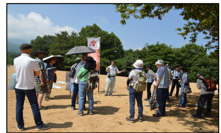
じょうもん祭り遺跡探検隊 (大森勝山遺跡)