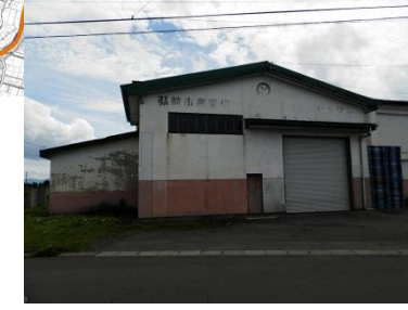
JAひろさき船沢りんごセンター