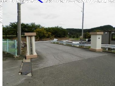
弘前第二養護学校