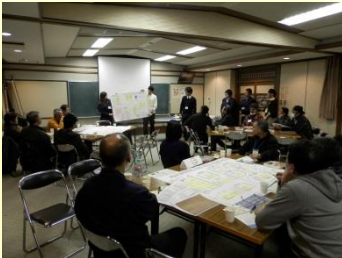
まち育てミーティングの様子