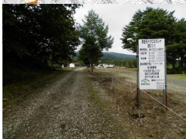
弥生モトクロスランド