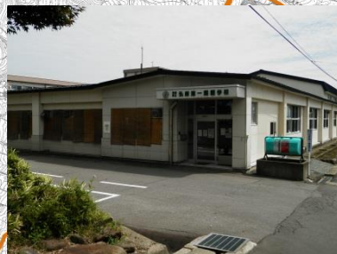
弘前第二養護学校