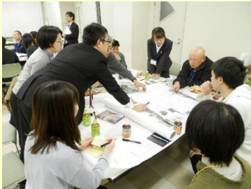
まち育てミーティングの様子