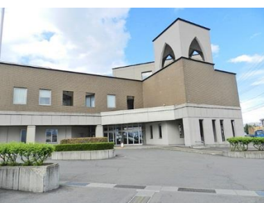
弘前市総合学習センター