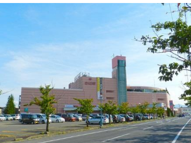
さくら野百貨店弘前店