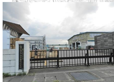
総合地方卸売市場弘果弘前中央青果