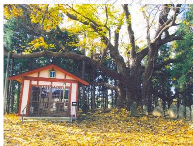
身代地藏尊(保存樹木)