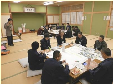
まち育てミーティングの様子